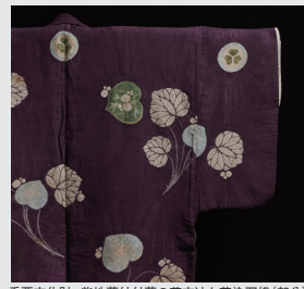
重要文化財 紫地葵紋付葵の葉文辻ヶ花染羽織(部分) 徳川美術館蔵

徳川美術館 TEL:(052)935-6262 FAX:(052)935-6261