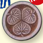
特製マグネット (木製)