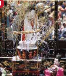
【湯取車】ゆとりぐるま (湯取車保存会)