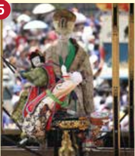
【鹿子神車】かしかじんしや (西之切奉賛会)