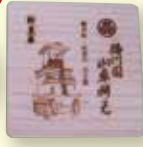
特製コースター (木製)