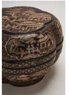
螺鈿梅花形楼閣人物図食籠 (部分) 明時代 15-16世紀 徳川美術館蔵

本展では数ある工芸技術の中でも、こうした素材や形がぴったりと組み合わせられた「ハマる(嵌る)」側面に着目し、工芸作品の様々な姿や秘密に迫ります。「ハマる」をキーワードに、工芸作品の輝き続ける魅力にもハマってみてください。