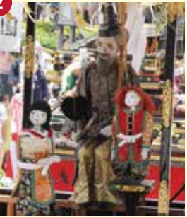
【王義之車】おうぎしや (古出来町奉賛会)