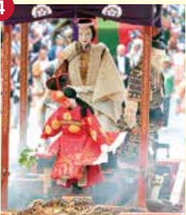
【神皇車】じんこうしや (筒井町神皇車保存会)