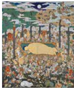
仏涅槃図 江戸時代 17世紀 建中寺蔵

本展では、建中寺が所蔵する宝物を中核に、所縁の品々を通覧することで、尾張徳川家とともに歩んできた建中寺の歴史を紐解きます。また近年、修復が進められている建中寺の御霊屋についても紹介します。