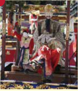
【河水車】かたしや (中之切奉賛会)