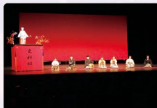
[8月15日] 犬山高校・絡繰り文化部