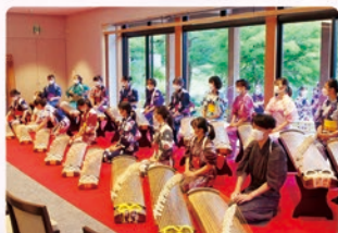
[8月12日] 菊里高校・箏曲部