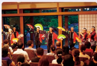
[8月14日] 松蔭高校・和太鼓部