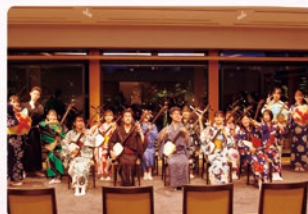
[8月13日] 名古屋西高校・津軽三味線部