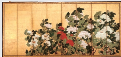
牡丹図屏風 八曲一双の内左隻